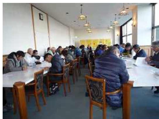
従業員の打合せ会議にて安全教育を実施