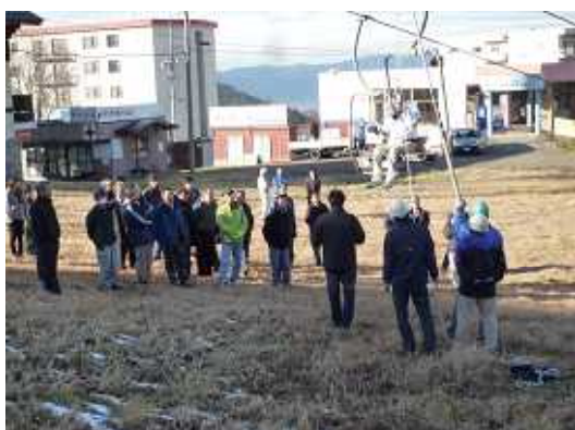
リフト従業員とパトロールによる救助訓練